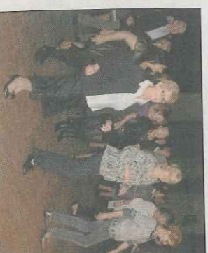
Concert et thé dansant pour souffler les bougies.